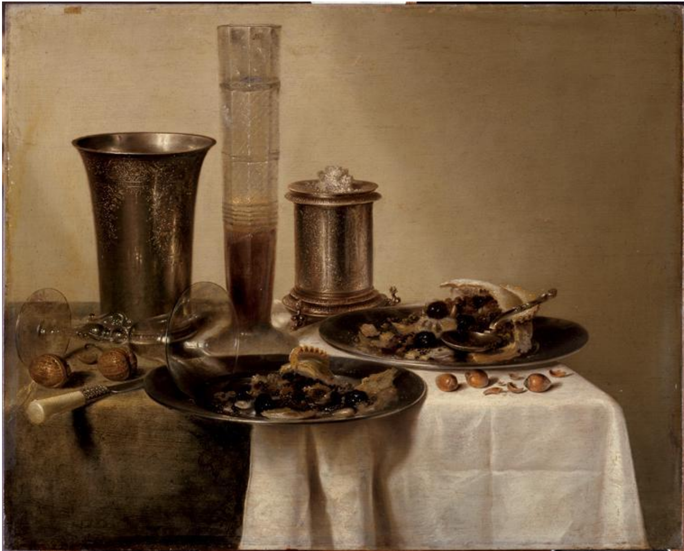
Un Dessert - Heda Willem Claesz