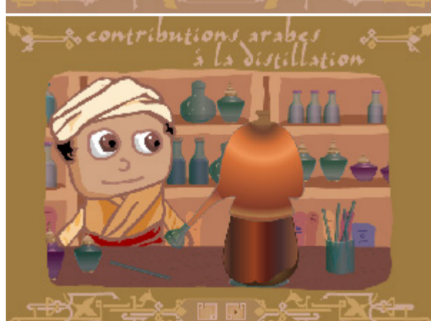
L'alambic d'Abu Bakr al Razi.