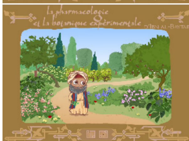
La pharmacologie et la botanique expérimentale d'Ibn al-Baytar