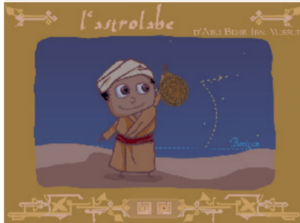
L'astrolabe d'Abu Behr Ibn Yussuf