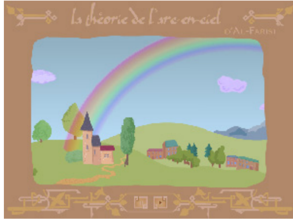
La théorie de l'arc-en-ciel d'al-Farisi

En attendant de les résoudre, si vous n'arrivez pas à lire les animations sur votre ordinateur, merci d'essayer avec un autre navigateur.