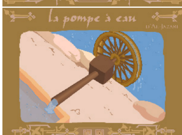
La pompe à eau d'al-Jazari