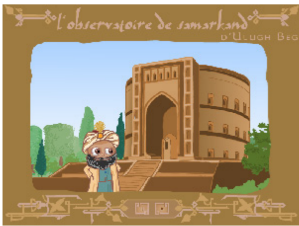
L'observatoire de samarkand d'Ulugh Beg