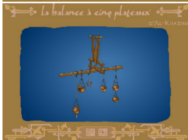
La balance à cinq plateaux d'al-Khazini