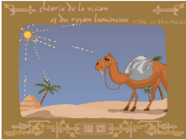
Théorie de la vision et du rayon lumineux d'Ibn al-Haytham