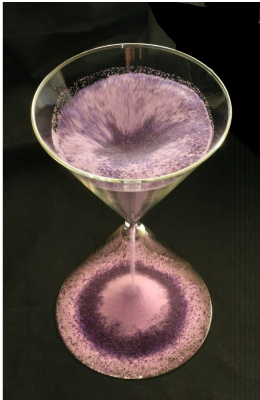
Figure 1 - Ecoulement d'un mélange de grains dans un sablier. Les gros grains colorés s'écoulent jusqu'au bas de l'avalanche alors que les plus petits (blancs) restent au voisinage du sommet du cône inférieur. ( Ce que disent les fluides page 145, Editions Belin).

Nous ne considérons ici que la seconde propriété.