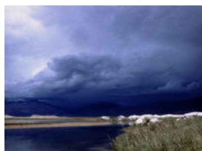
Lac Pongong Tso-Pingoo au Tibet.

Ce débit correspond à environ deux cents fois le débit du Rhône, ou encore, à deux fois celui de l'Amazone