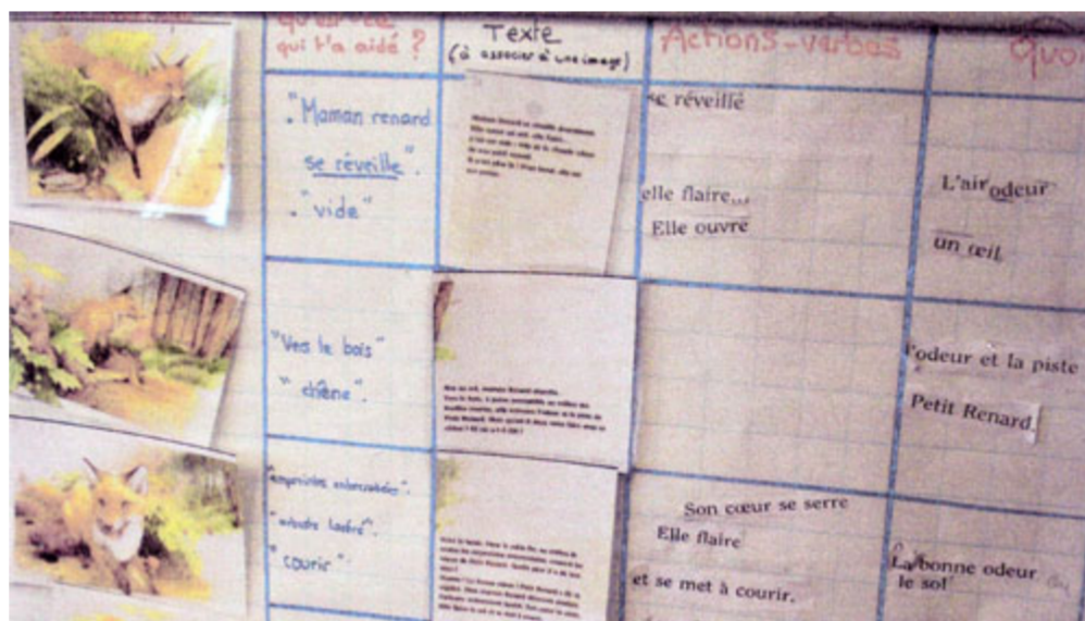
Travaux des élèves sur l'album « Petit renard perdu ».