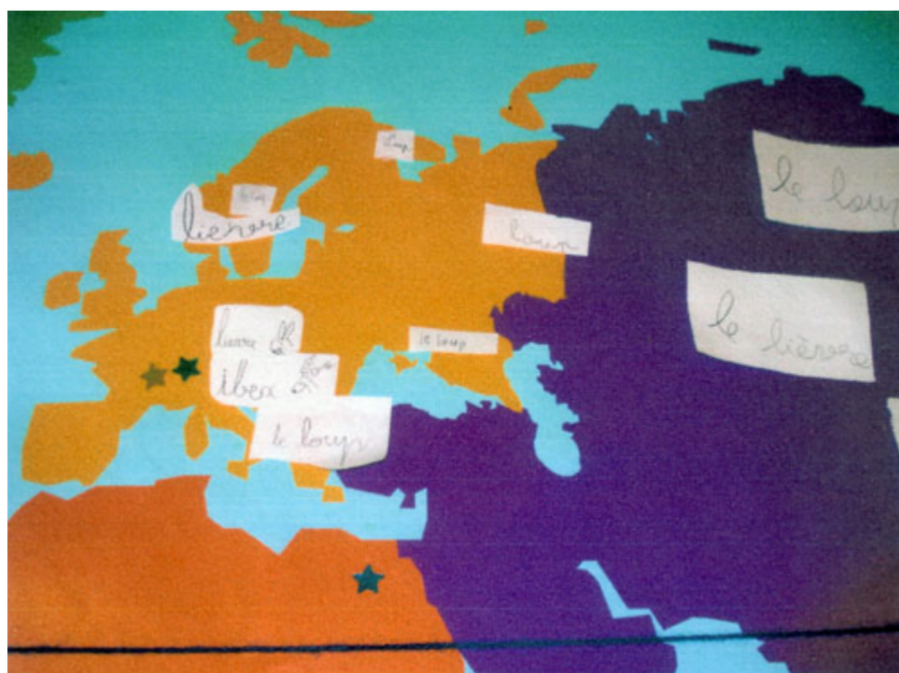
Etude des fuseaux horaires