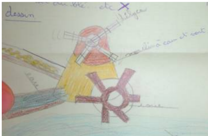
Conception et représentation d'un moulin.