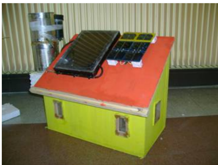
Un éco-logis fabriqué par les élèves.