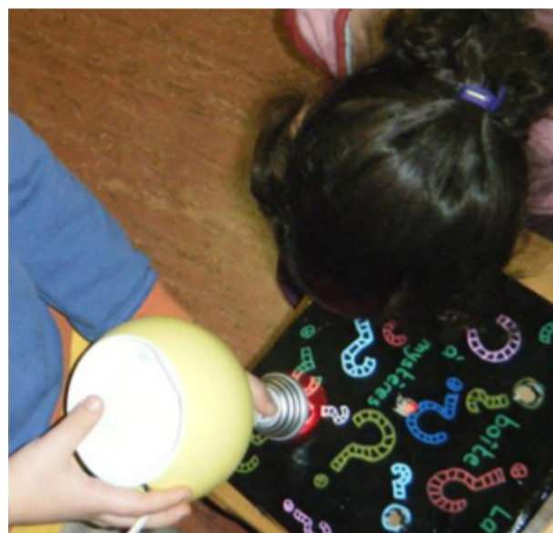
Nécessité d'éclairer l'intérieur de la « boîte à mystère » pour observer les objets à l'intérieur