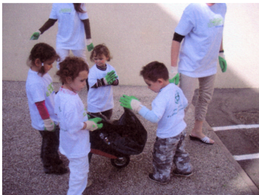
Grand nettoyage des abords de l'école