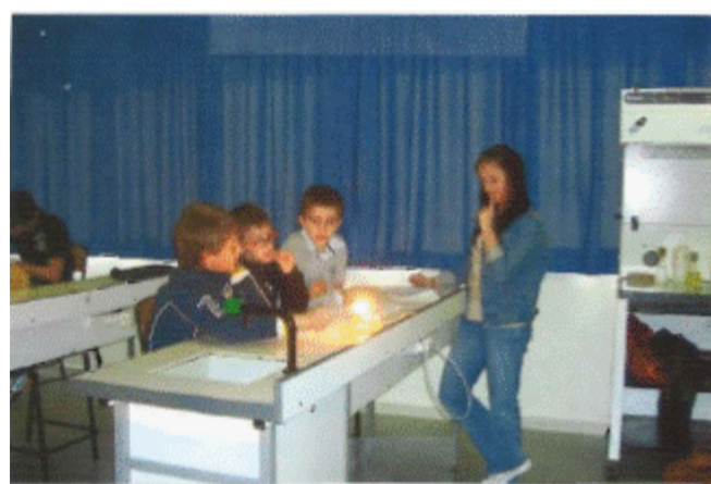
Tutorat entre lycéenne et élèves

Consulter le dossier complet (pdf, 1.8Mo)